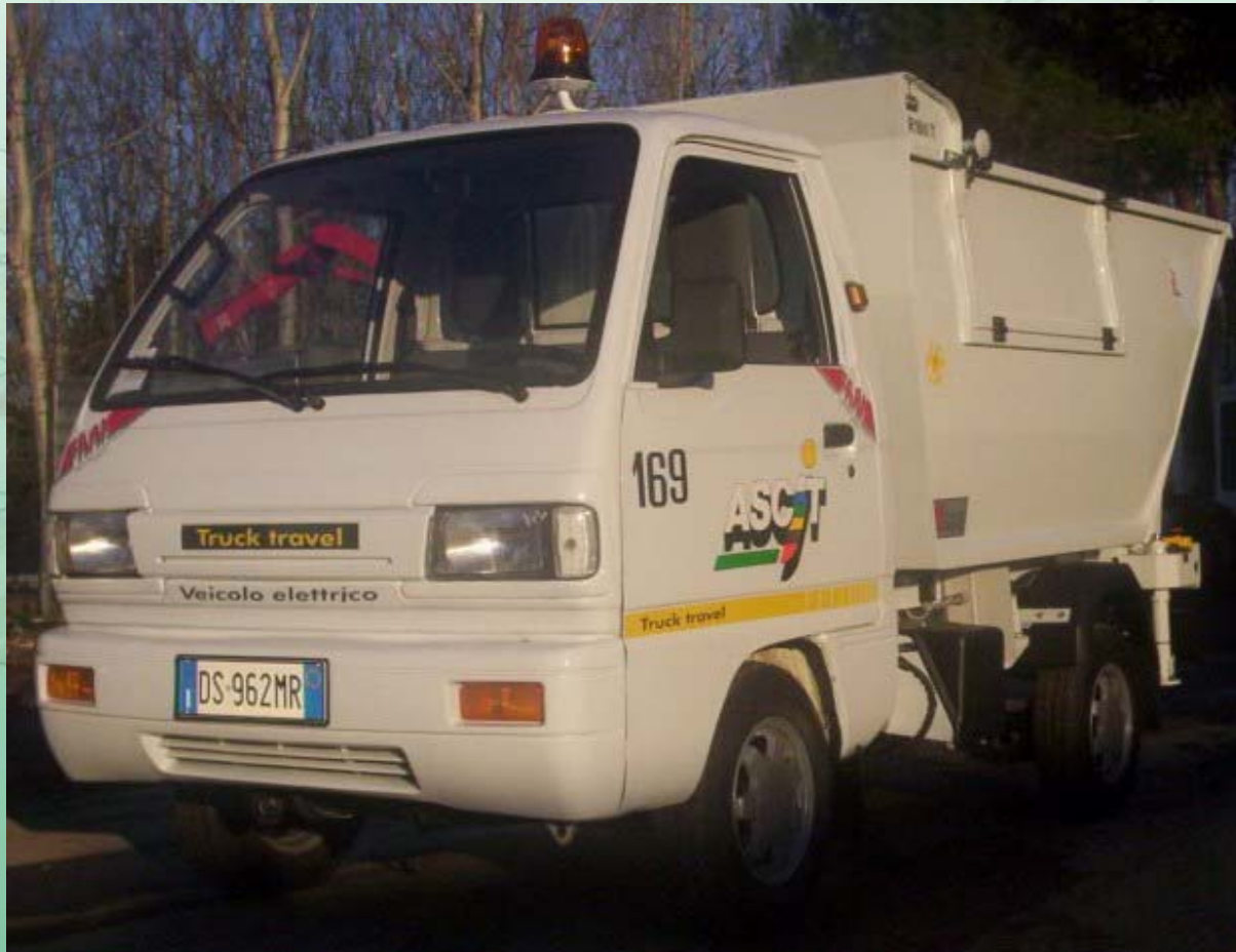
Uno dei porter elettrici usati da ASCIT